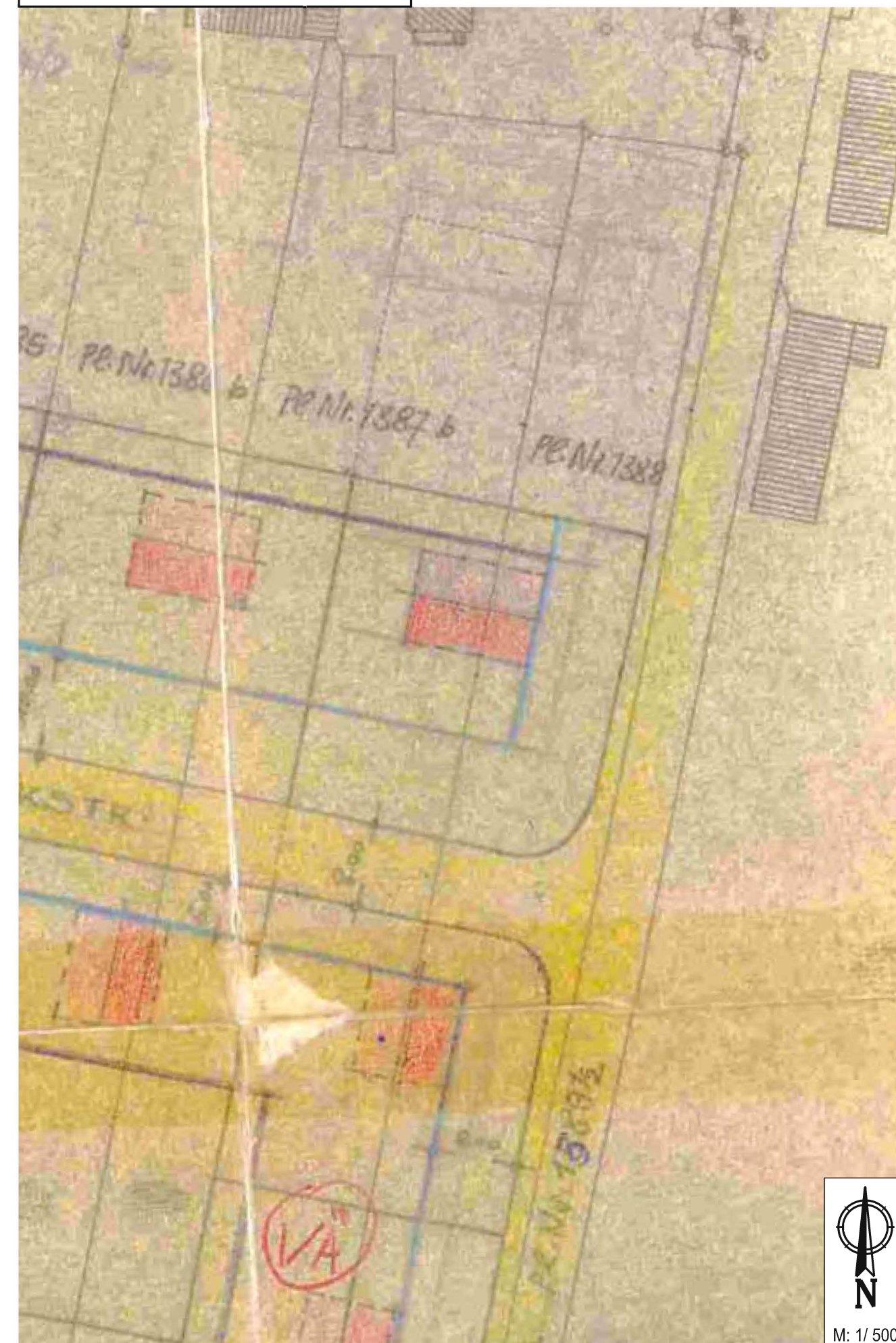
Lageplan 1 : 500, bisherige Fassung